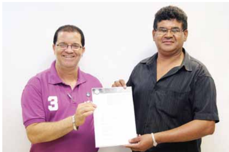
SindMetal-GO firma Acordo Coletivo com proprietário da empresa Rocha Equipamentos e garante benefícios para os trabalhadores.