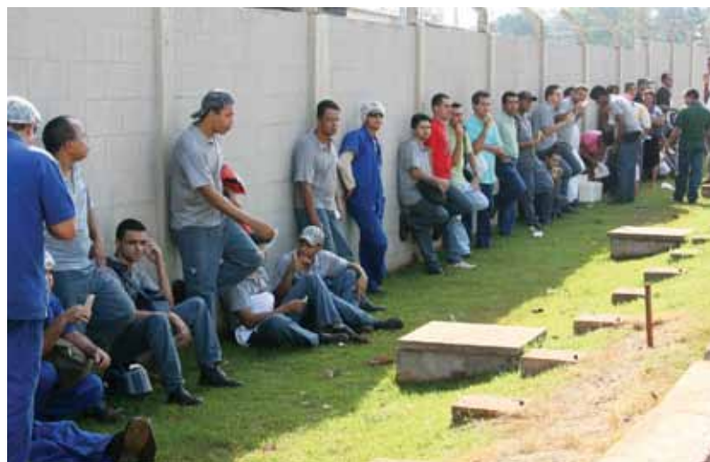
Trabalhadores da Hypermarcas participam de assembleia que finaliza a Campanha Salarial de 2011