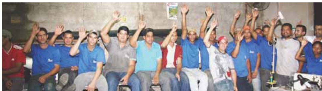
Trabalhadores da Rocha Equipamentos participam de assembleia em prol de Acordo Coletivo de Trabalho

O Acordo Coletivo de Trabalho pode ser o instrumento mais eficiente para a obtenção do equilíbrio entre o capital e o trabalho no Brasil. A mais de uma década,