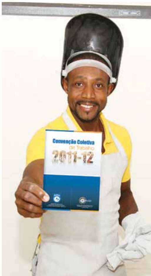
A Convenção Coletiva de Trabalho 2011-12 já está disponível no portal www.sindmetalgo.com.br

Conheça as cláusulas exclusivas que garantem benefícios para a categoria