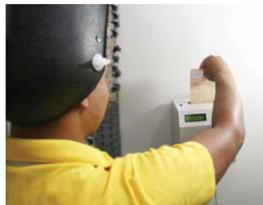
Trabalhador que não falta e não atrasa garante 10% de Prêmio no salário

A CCT prevê também o prêmio de assiduidade e pontualidade, que consiste em um bônus mensal de 10% do salário contratual para o trabalhador que cumprir integralmente e corretamente sua carga horária de trabalho. O valor descontado no salário do metalúrgico em função da