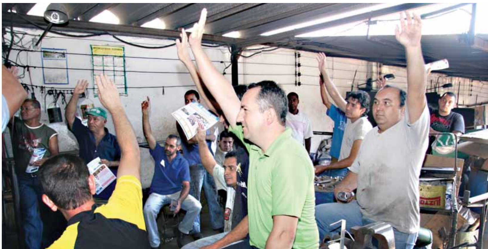
Trabalhadores da Metalúrgica Rezende aprovam o índice de reajuste proposto para Acordo Coletivo de Trabalho