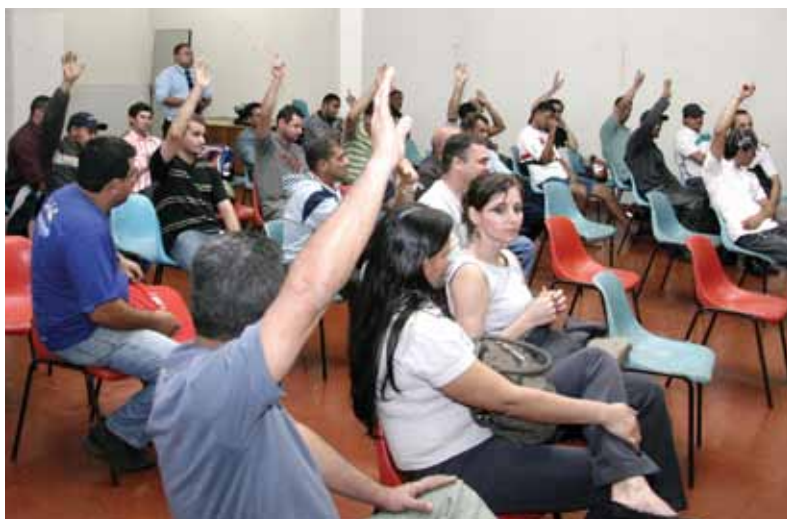
Em assembleia geral, trabalhadores votam pelo fechamento da Convenção Coletiva de Trabalho, com aumento salarial de 8,5%

Na ocasião, o SindMetal-GO organizava a greve — decretada pelos empregados da fábrica de lã de aço —, quando a direção da empresa resolveu fazer uma contraproposta de aumento no valor do tíquete alimentação. Os trabalhadores avaliaram a oferta, e a aceitaram, dando fim ao movimento paredista. Veja mais informações na página 6.